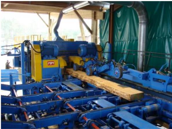
Module Canter devant une Cobra REX