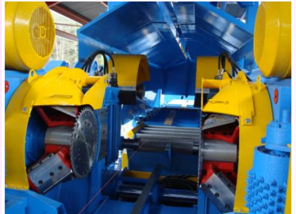
Module Canter sur un Télétwin circulaire